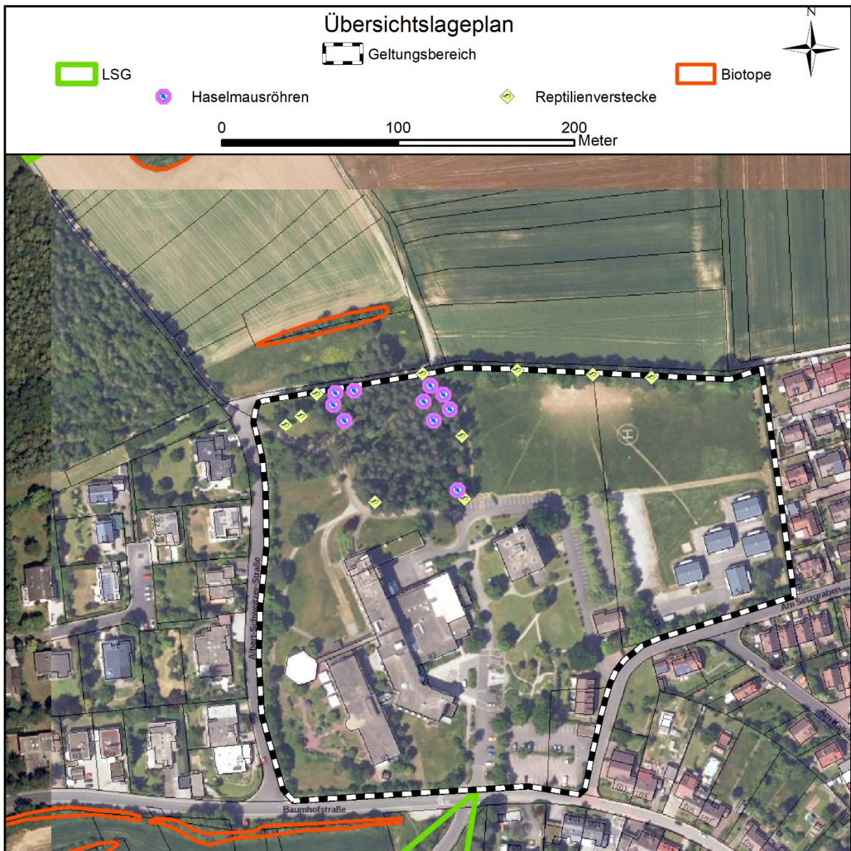
Abb. 2: Übersichtslageplan über Luftbild