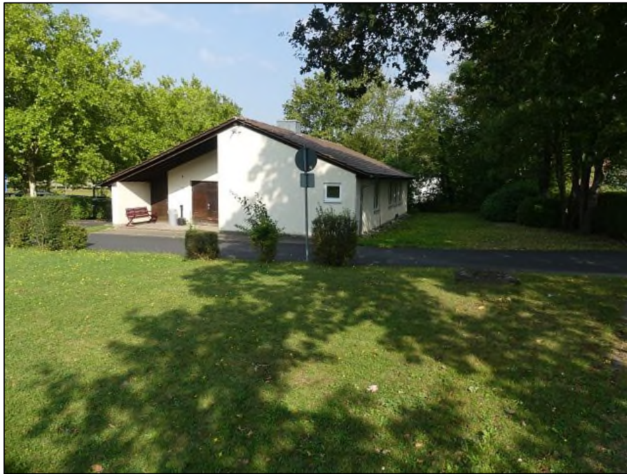
Abb. 9: Nebengebäude im Südosten des Geltungsbereiches (17.09.2024)