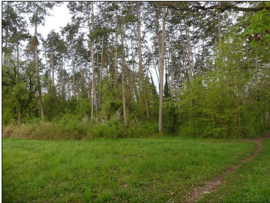
Abb. 3: Ostseite des Wäldchens im Norden des Geltungsbereiches, Blick nach Westen (09.04.2024)