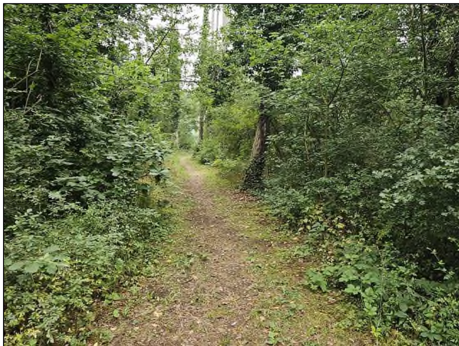
Abb. 4: Wäldchen im Norden des Geltungsbereiches, Blick nach Westen(14.04.2024)