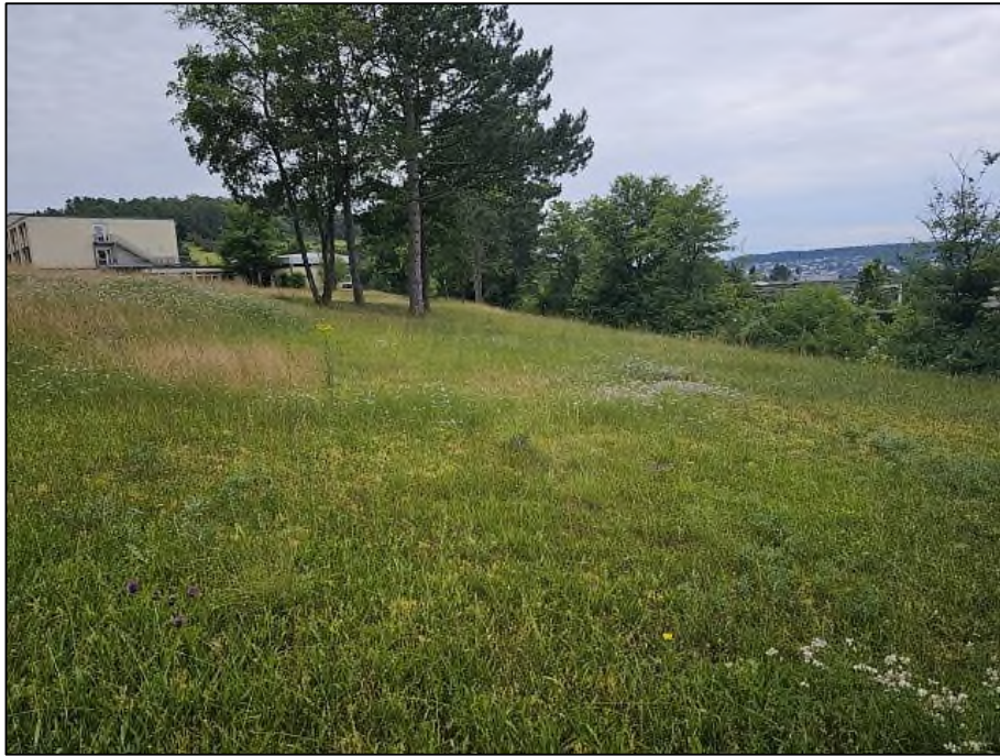
Abb. 7: Magerrasen im Westen des Geltungsbereiches, Blick nach Süden (02.07.2024)