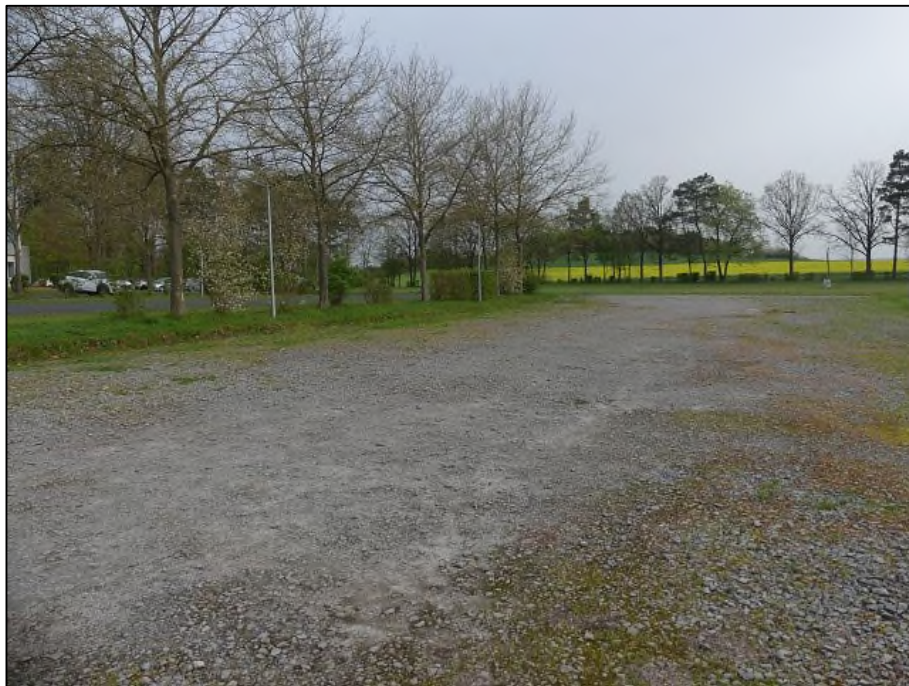
Abb. 10: Geschotterter Parkplatz im Südosten des Geltungsbereiches, Blick nach Norden (09.04.2024)