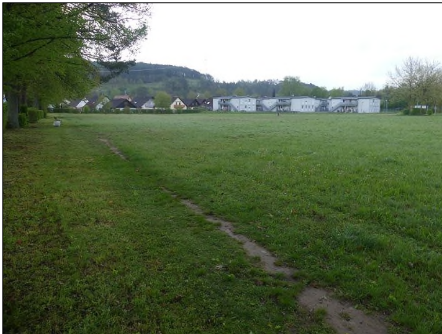
Abb. 6: Grünland im Nordosten des Geltungsbereiches, Blick nach Osten (17.04.2024)