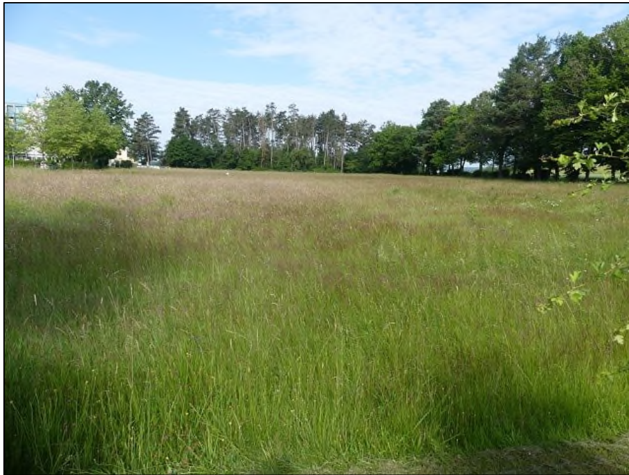
Abb. 5: Grünland und Baumreihe im Nordosten des Geltungsbereiches, Blick nach Westen (13.06.2024)