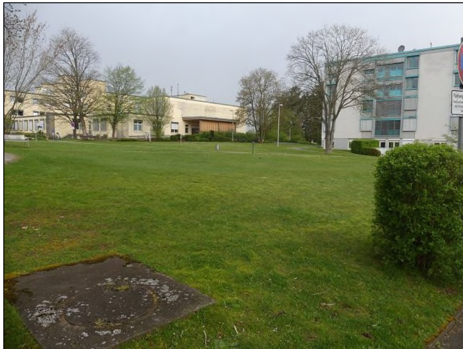
Abb. 8: Rasenflächen im zentralen Teil des Geltungsbereiches, Blick nach Westen (09.04.2024)