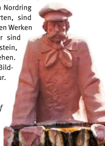
Fischerbrunnen auf dem Marktplatz