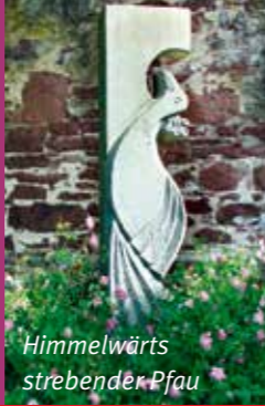
Himmelwärts strebender Pfau