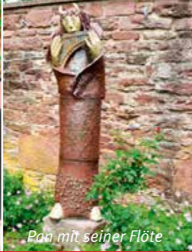
Pan mit seiner Flöte