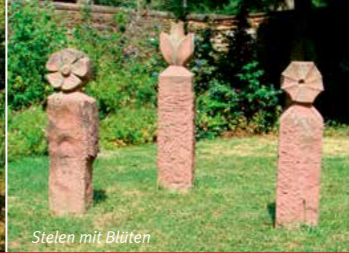
Stelen mit Blüten