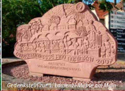
Gedenkstein zur 1. Laurenti-Messe am Main