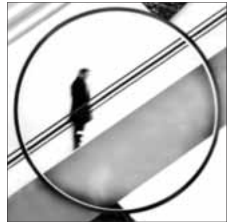
Fotograf Georg Märker stellt bis 24. Juni 2018 im Franck-Haus von Marktheidenfeld aus.

Die Ausstellung im Franck-Haus läuft bis Sonntag, 24. Juni 2018.