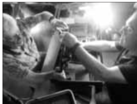
Mit vereinten Kräften waren die Experten beim Repair Café erfolgreich.

Die drei in Marktheidenfeld engagierten ehrenamtlichen Reparatoren im Elektrobereich waren wie immer motiviert und geduldig bei der Sache. Zudem war jetzt im Frühling zu Beginn der Fahrradsaison der Fachmann für Fahrräder im Einsatz, auch wenn der Andrang auf diesem Sektor gering blieb.