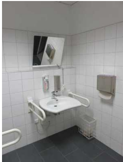
WC für Menschen mit Behinderung