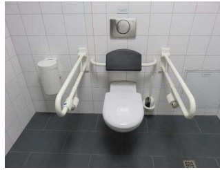
WC für Menschen mit Behinderung