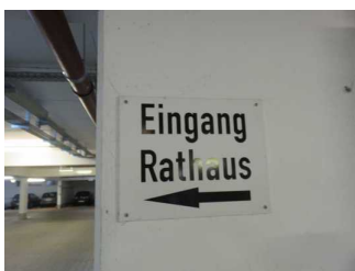
Beschilderung zum Eingang

Es ist ein allgemeiner Parkplatz vorhanden.