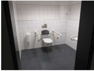
WC für Menschen mit Behinderung