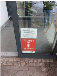
Tür im Eingangsbereich