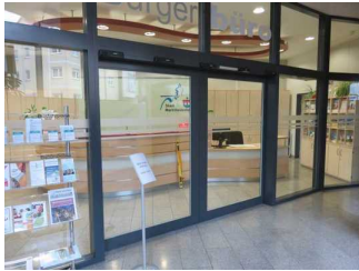
Eingang zur Touristinformation