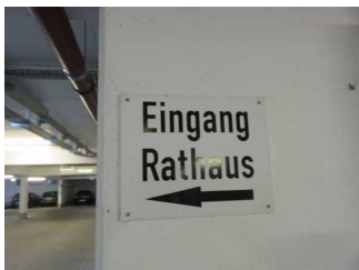
Beschilderung zum Eingang

Es ist ein allgemeiner Parkplatz vorhanden.