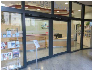
Eingang zur Touristinformation