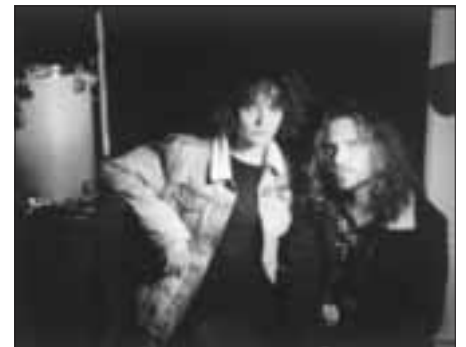
Me + Marie spielen am 28. Juli 2018 im Stadtgärtchen von Marktheidenfeld.