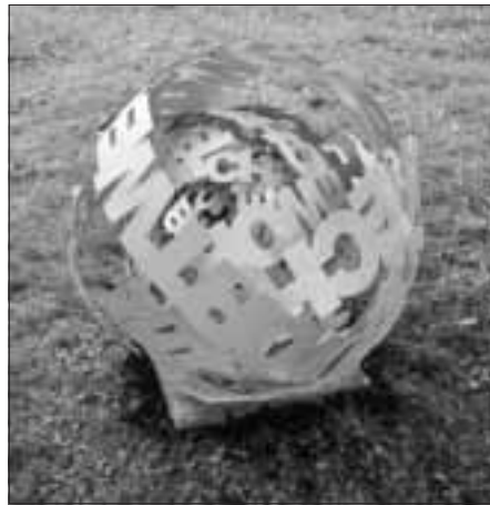
Die Skulpturen von neun Künstlern sind ab 11. Mai 2018 als Teil des Festivals „kunst&gesund“ in Marktheidenfelder Innenstadt zu sehen.

Eine Kooperation zwischen Stadtbibliothek, Stadt und Kreisseniozentrum Marktheidenfeld