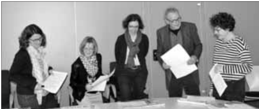
Die Meefisch-Jury hat über 120 Werke begutachtet. 20 Finalistenbeiträge wurden ausgewählt.

Weitere Informationen zum Meefisch gibt es unter www.der-meefisch.de