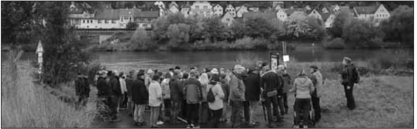
Auf großes Interesse stieß die Eröffnung des Kulturwanderweges „Auf der Rothenfelser Sonnenseite“. Unser Foto zeigt die Gruppe an der Informationstafel „Am Fahr“ in Zimmern.

Anschließend machte man sich auf, um den etwa siebeneinhalb Kilometer langen, bereits dritten Kulturweg Marktheidenfelds, zu erkunden. Der landschaftlich reizvolle Rundweg trägt den Namen „Auf der Rothenfelser Sonnenseite“ und führt vorbei an Naturdenkmälern, archäologischen Zeugnissen und Sehenswürdigkeiten durch den Stadtteil Zimmern und die angrenzenden Gemarkungen Roden und Karbach. Informationstafeln geben Aufschluss über den Streckenverlauf und die Höhepunkte des Kulturweges Marktheidenfeld III.