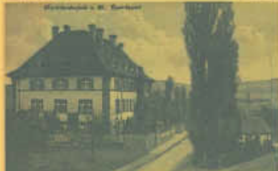
14 Uhr: „Vom königlichen Bezirksamt zum Sitz der Verwaltungsgemeinschaft“ - eine Führung mit Lokalkolorit durch das 100-jährige Gebäude der Verwaltungsgemeinschaft Marktheidenfeld, Petzoldstraße 23