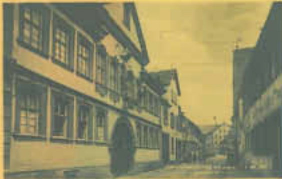
11 Uhr: „Eine blaue Stunde“ - eine Führung durch das Franck-Haus, Untertorstraße 6